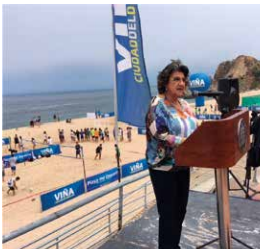
Alcaldesa Virginia Reginato en inauguración de la Playa del Deporte.

Viña del Mar se prepara para vivir un entretenido y familiar verano 2019, un programa de eventos deportivos, culturales y playeros en el cual colaboran en su realización el sector privado, gestores culturales, emprendedores y distintas unidades municipales.